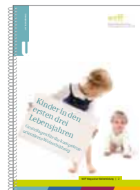
Band 2: Kinder in den ersten drei Lebensjahren. Grundlagen für die kompetenzorientierte Weiterbildung