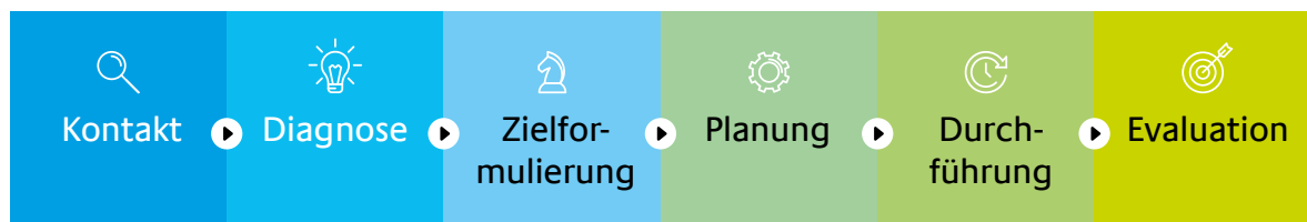
Abb.: Phasen der Teamentwicklung

Quelle: Eigene Darstellung in Anlehnung an Kauffeld/Schulte 2014