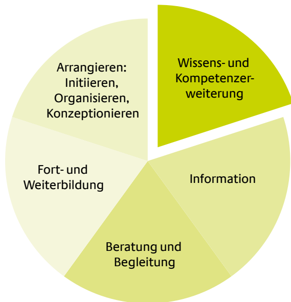
Abb. 1: Handlungsformen der Fachberatung