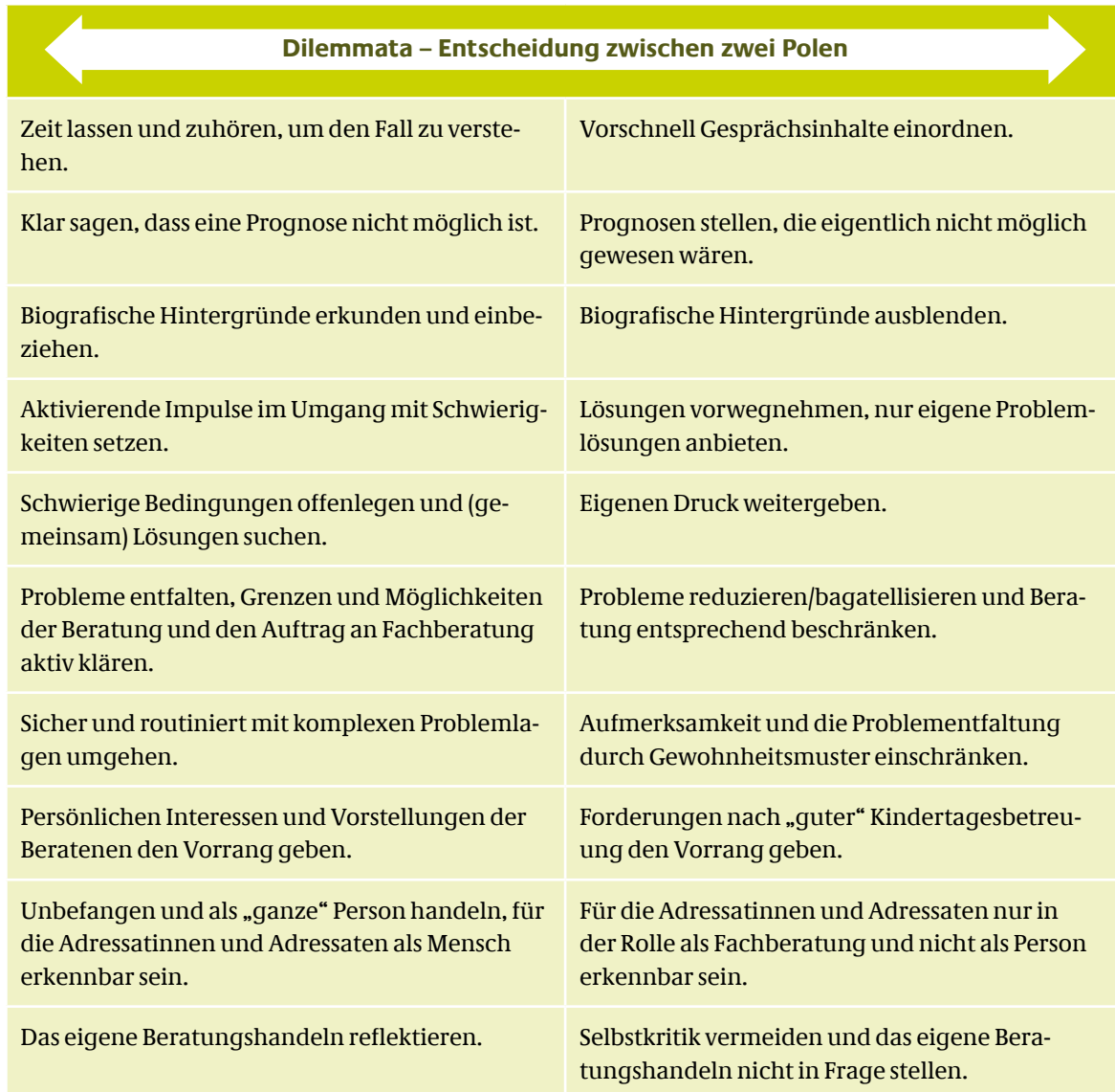
Tab. 3: Evaluationsbogen (Auszug)