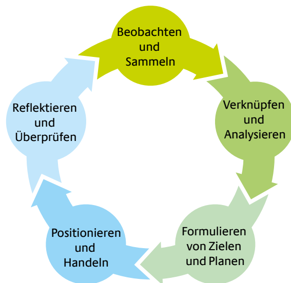
Abb. 2: Kontinuierlicher Qualitätsentwicklungsprozess Fachberatung